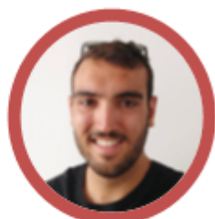
Tournois Léo FAZENDEIRO